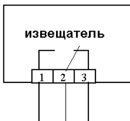
Рис.2 Под воздействием магнитного поля контакт 2 размыкается с контактом 3 и замыкается с контактом 1. Маркировка выводов: 1- красный, 2- черный, 3- белый